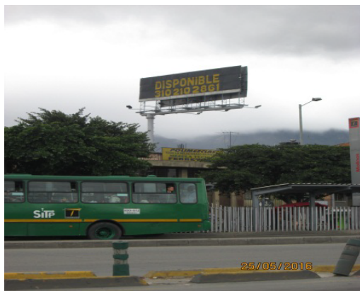
Valla panorámica sentido N-S