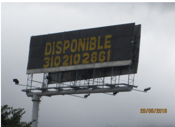
Valla publicidad sentido N-S